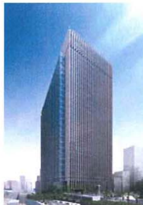
sola city Conference Center ソラシティカンファレンスセンター

101-0062 かんだするがだい 東京都千代田区神田駿河台 4-6 御茶ノ水ソラシティ 電話：03-6206-4855 Fax：03-6206-4854 mail：info-cc@solacity.jp